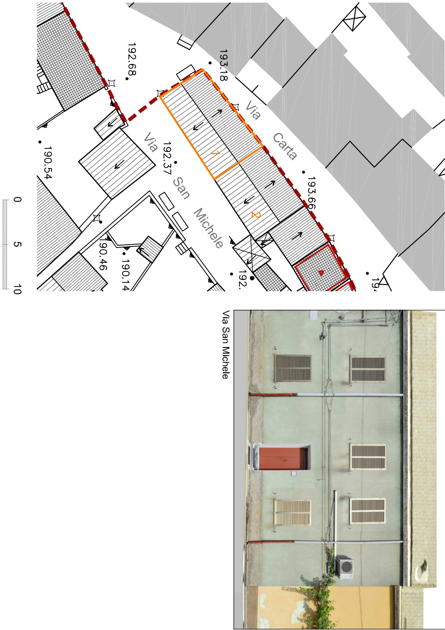
Perimetro unità edilizia n. 1 corpo di fabbrica appartenente all'isolato 11