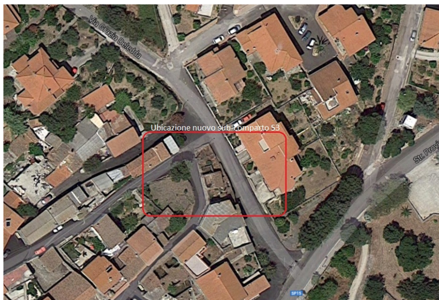
1. Individuazione nuovo sub-comparto S3 su base ortofoto

L'individuazione di un nuovo sub-comparto S3 area per standards, da destinare per servizi a piazza e verde attrezzato urbano, sito al limite nord-ovest della Zona B al confine con la Zona C di espansione residenziale, tra le Vie Adua e Grazia Deledda, della superficie di circa mq. 135, in luogo di un comparto edilizio costituito da un vecchio edificio quasi completamente diruto ormai in disuso e la sua pertinenza, in cui l'Amministrazione Comunale porrebbe il vincolo preordinato all'esproprio. In quest'ottica la Variante al P.U.C. costituisce uno strumento in grado di recuperare e valorizzare in maniera precisa e puntuale un'area priva di qualità, abbandonata da anni per la quale non vi era interesse al recupero dal privato cittadino.